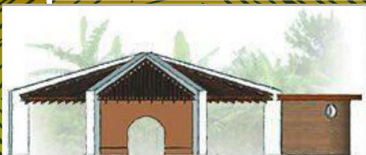
ELEVAÇÃO LATERAL DIREITA